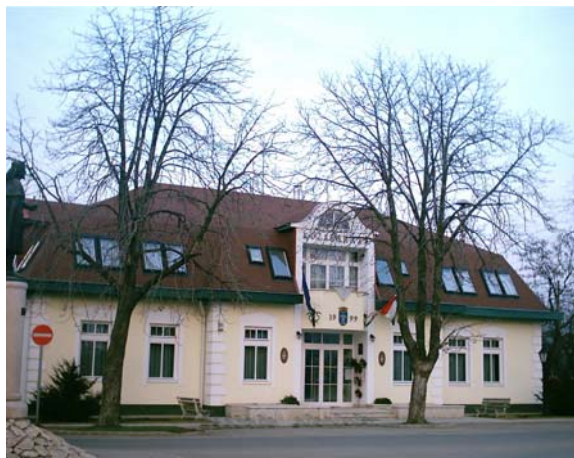
Szajol Önkormányzati Hivatala

Szajol főtere, ahol az önkormányzat és a katolikus templom is látható