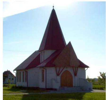
A református templom a 4. számú főút mellett