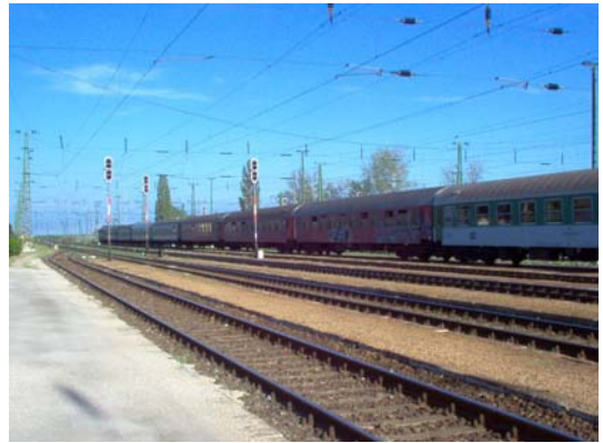
A Szajolon keresztülhaladó vasútvonal