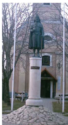
Szent István szobra a főtéren