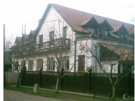
A magánvállalkozásban működő Godó Panzió