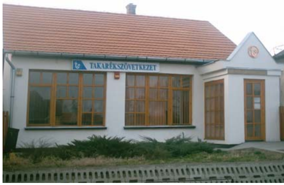
A településen működő Takarékszövetkezet