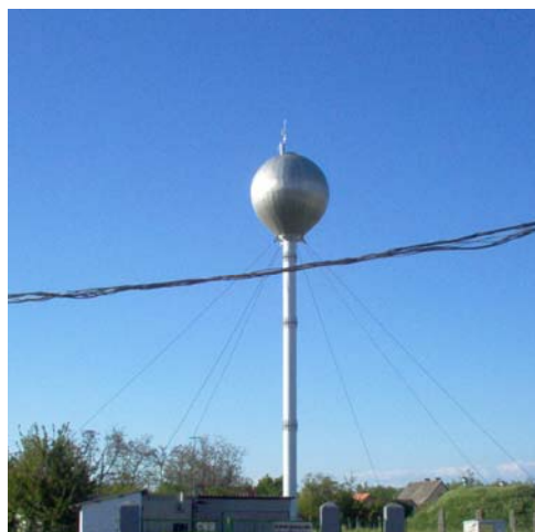
A szajoli víztorony

A település kiépített víz hálózattal rendelkezik, hálózata bővíthető, új településrészek beköthetők. Az ivóvíz megtáplálása Szolnokról érkezik. A település rendelkezik víztoronnyal, mely 100 m 3 -es, 32 m magas.