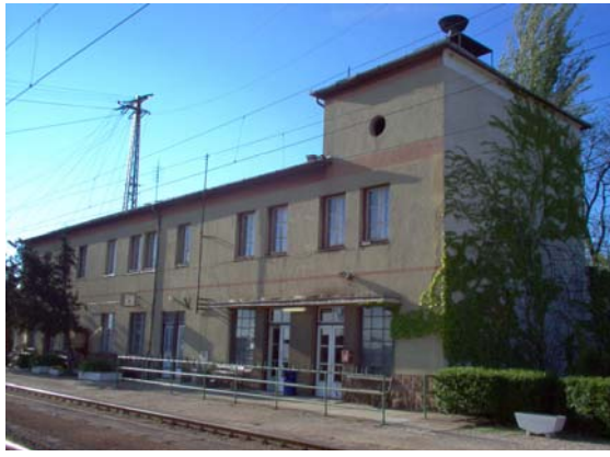
A szajoli vasútállomás