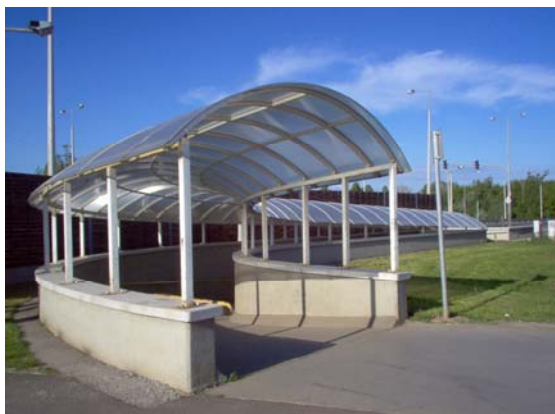
Gyalogosok és kerékpárosok számára kialakított aluljáró