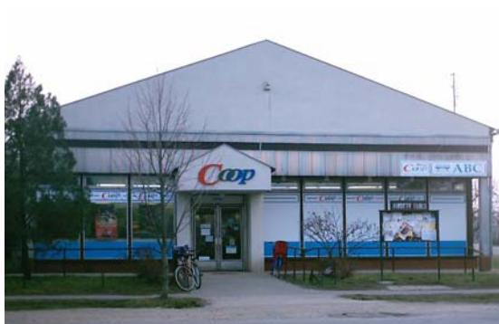
A COOP áruház