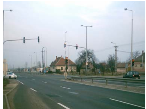
A 4. számú főút, mely kettészeli a települést