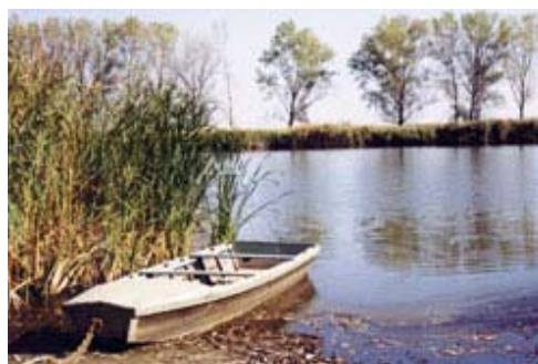
A Holt-Tisza Szajolban

A holtágaknak korábban jelentős idegenforgalmi, turisztikai szerepe volt. Napjainkban újra fellendülni látszik a horgászat iránti igény, ezért e holtágak rehabilitációját kell kitűzni célul. Ennek gyakran mutatkoznak akadályai, többek között a hiányos vízutánpótlás, a nádas rohamos terjedése, a hínár túlburjánzása stb.