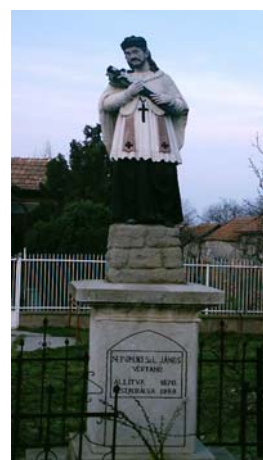
Nepomuki Szent János szobra