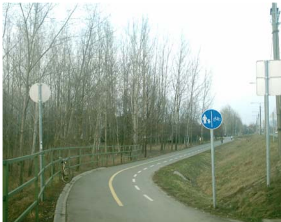
Kerékpárút a főút mellett