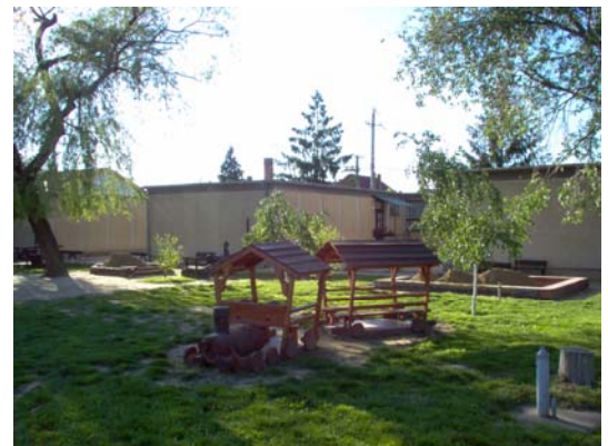
Az újtelepi óvodaegység