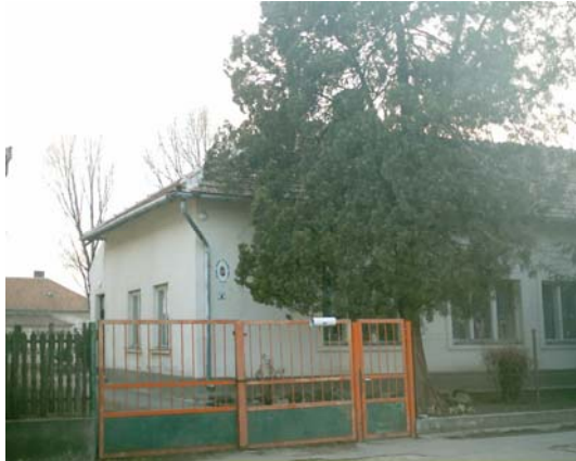
Az Ófaluban található iskola