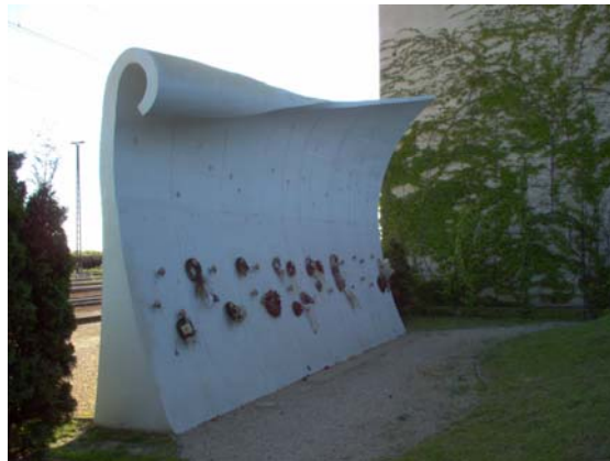
A szajoli vasúti szerencsétlenség emlékére állított emlékmű