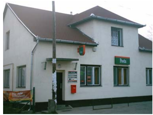
A szajoli Posta