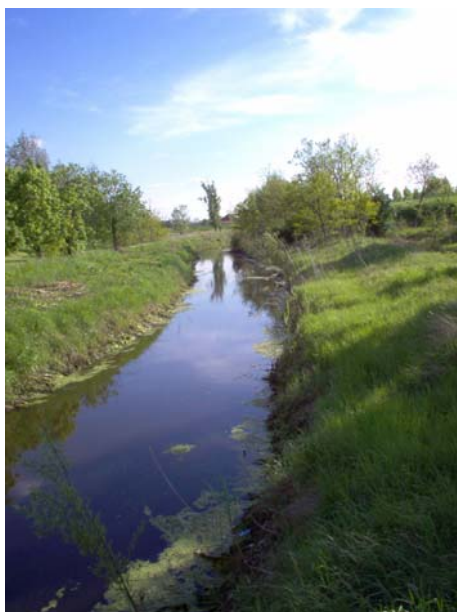
Az I. számú főcsatorna Szajolban