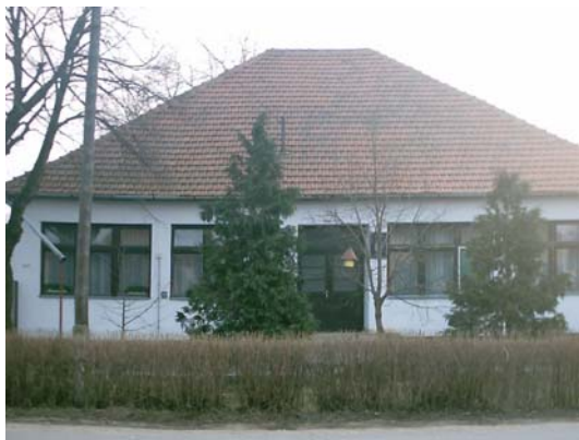
Az óvoda Ótelepen lévő épülete