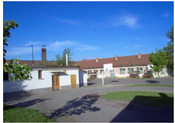
Az Újtelepen működő iskolaegység