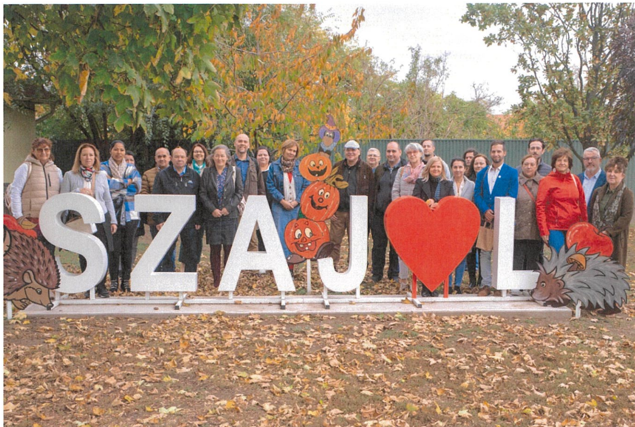
„Látóút” program résztvevői

2023.november 20. A Szajoli értékei kiadvány szerkesztői változatának átadása a Repro nyomdának A Szajoli Értékek kiadvány első alkalommal 2020-ban került kiadásra 1500 példányban. Ezek a példányok mára teljesen elfogytak. Időközben a helyi értékek is felszaporodtak. Így időszerűvé vált a második kiadás megrendelése.