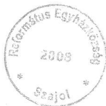
Rác Páter Béláné református lelkipásztor